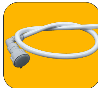
Manguera corta de alimentación con conector de 3/4"