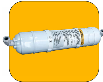
Filtro con codos de unión de 1/2"