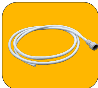
Manguera de alimentación con conector de 1/2"