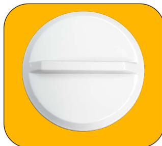
Tapa de depósito de garrafón